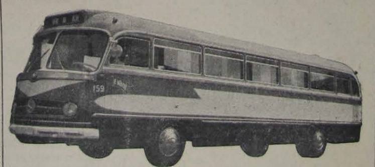
Um dos 12 ônibus adquiridos pela Evanil, nº de ordem 159 e que foi o primeiro a rodar na linha Nova Iguaçu—Rio

A Empresa Viação Automobilística Nova Iguaçu Ltda. (EVANIL), que possui uma frota de 43 carros, uma dezena dos quais nas linhas de Rezende, Lambari, São Lourenço, Itaipua e Cruzeiro, acaba de adquirir e valorizar sobremaneira essa frota, pois adquiriu nada menos que doze ônibus de luxo, com ar refrigerado e capacidade para 40 passageiros. Trata-se de veículos do último tipo, modelo HL, Super B da Mercedes Benz.