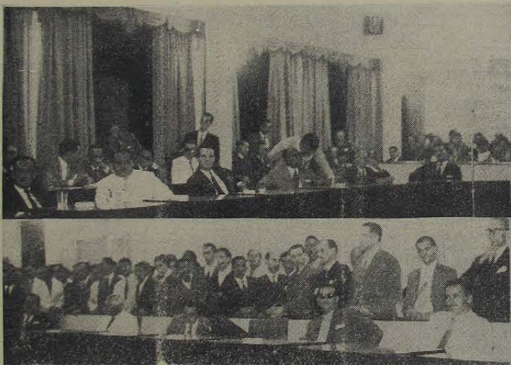
Dois aspectos do elegante e confortável plenário nas novas instalações do Legislativo Municipal, vendo-se ainda parte da assistência que ali compareceu

plas, elegantes e confortáveis, à altura da importância social, política e cultural deste Município, que sobressai indiscutivelmente entre as unida-