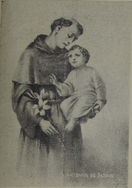
SANTO ANTONIO DE JACUTINGA