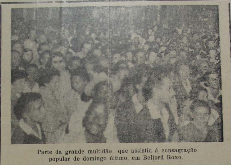
Parte da grande multidão que assistiu à consagração popular de domingo último, em Belford Roxo.

Cidadão de prestígio popular, líder das classes industriais e comerciais deste Município, Quintela é um nome integrado