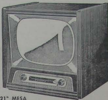
TV 21" MESA (21 TR 115-A/02)

Fácil manejo - Seletor de 13 canais - Novo tubo de 21" com tela aluminizada - Operação "não-síncrona" - 21 válvulas "Noval" e 3 diodos de germanium - Vidro protetor de 6 mm de espessura.