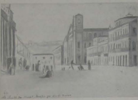
Uma das páginas do álbum "O velho Rio de Janeiro"

é acontecimento cultural, história e arte. Que é isto? Um álbum que contém as gravuras de Thomas Sonder, o notável artista vienense que veio na comitiva de Leopoldina, consorte de Pedro I. Vê-se, aí, o Rio de