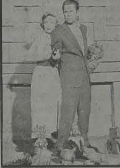
Cena do filme "Pergaminho fatídico"

Hoje — "Pergaminho fatídico", com Glenn Ford e Patricia Medina. Horário: 13.30, 15.30, 17.30, 19.30 e 21.30.