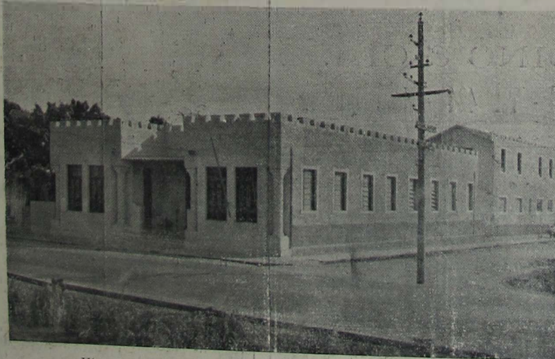
Vista lateral do Colégio, vendo-se, no fim, a nova construção

Gratuito, a funcionar a partir de 3 de Janeiro.