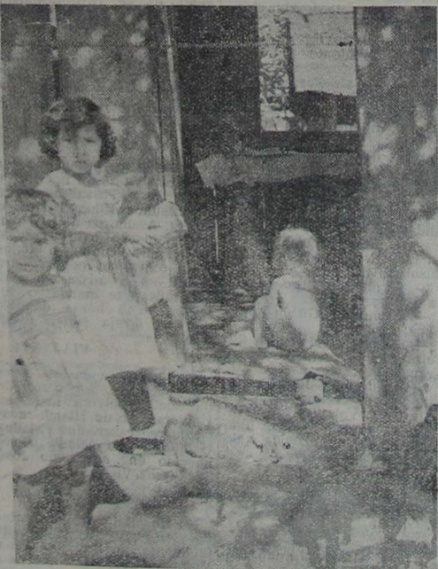
Muita ignorância, pobreza e milhões de microbios — são as condições que o Departamento Nacional da Criança procura eliminar por todos os meios disponíveis. Um deles — a Vacina Preventiva — ocorre para imunizar estas crianças contra as terríveis moléstias contagiosas.