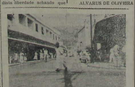
Um aspecto da av. Nilo Peçanha, nesta cidade

O réu estava preso, havia dois meses, aguardando julgamento e Deus sabe os maltratos que recebeu para apresentar-se no estado em que foi levado ao juiz. Com que espécie de gente privou ele? Que escola de crime, teria cursado nos sessenta dias em que esteve na prisão? O juiz concedeu-lhe imediata liberdade achando que