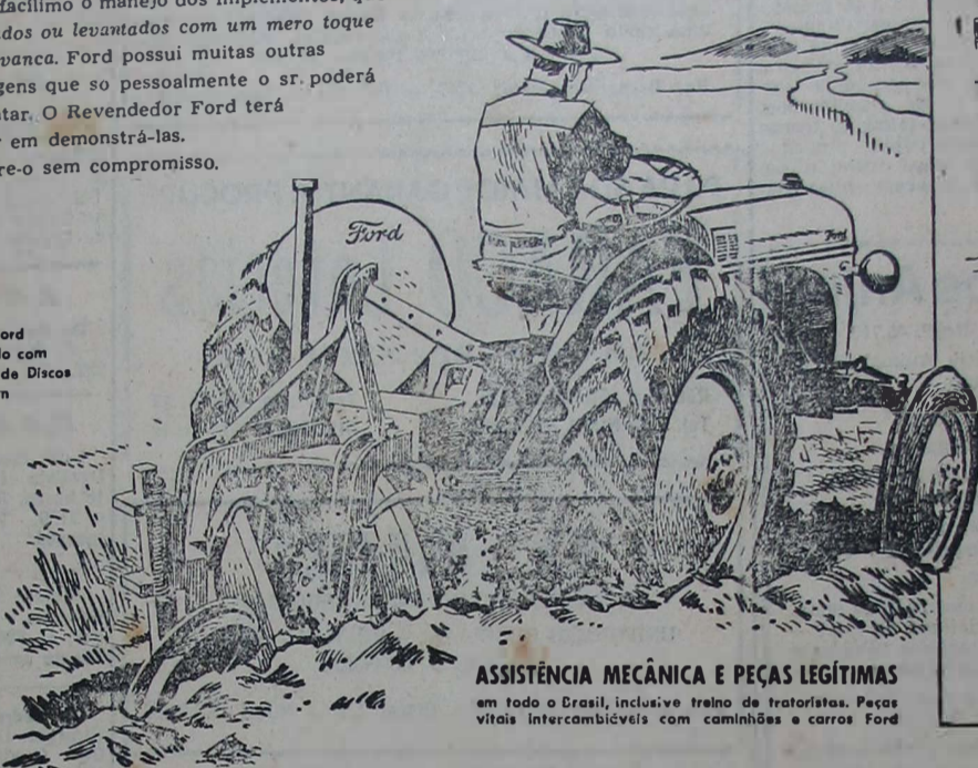
Trator Ford equipado com Aradores de Discos Dearborn

A capacidade de executar com rapidez - e economicamente - qualquer trabalho agrícola, é um dos característicos do Trator Ford de que mais se orgulham os engenheiros que o desenharam e construíram. A potência do motor e o baixo consumo de combustível permitem usar o Trator Ford, com igual vantagem, em pequenos trabalhos ou em pesadas tarefas de aração e discagem do solo. Seu aperfeiçoado sistema hidráulico torna fácil o manéjo dos implementos, que são abaixados ou levantados com um mero toque na alavanca. Ford possui muitas outras vantagens que so pessoalmente o sr. poderá constatar. O Revendedor Ford terá prazer em demonstrá-las. Procure-o sem compromisso.