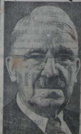
JOHN DEWEY, famoso educador e filósofo norte-americano.