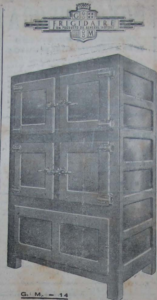
G. M. — 14

RUA BERNARDINO MELO, 1751 a 1771 — (Em frente à estação)