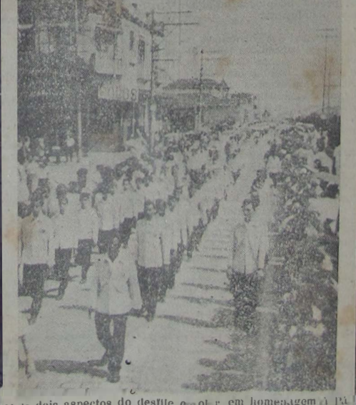
Mais dois aspectos do desfile escolar em homenagem à Pátria, no qual tomaram parte cerca de 7.500 crianças. Em cima, o primeiro grupo do Grupo de Santo Antonio, que recebeu ju-tos aplausos do povo. E, em baixo, a garbada mocidade do Ginásio Arnaldo Peixoto de Alencar, pela rua Bernardino Melo.