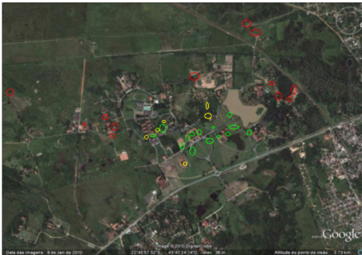
Figura 3: Imagem de satélite do campus da Universidade Federal Rural do Rio de Janeiro, indicando os locais onde foram feitos os registros alimentares das aves. As marcações verdes correspondem aos registros de Aratinga aurea , as em vermelho aos de Aratinga leucophthalma e as em amarelo aos locais em que ambas as espécies foram avistadas.