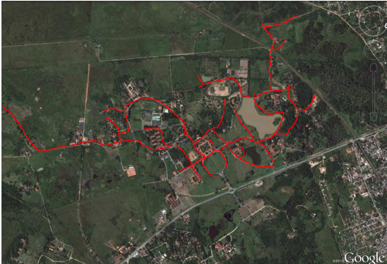
Figura 2: Imagem de satélite do campus da Universidade Federal Rural do Rio de Janeiro. Em vermelho destacam-se as estradas e trilhas percorridas neste estudo para a observação da dieta das aves.