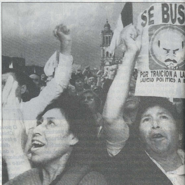
Um triste final para Salinas, que pretendia uma sucessão sem turbulências

Encurralado pela queda vertiginosa dos preços do petróleo e uma dívida que, entre 1974 a 1981, saltou de 26 bilhões para 76 bilhões de dólares, a chamada "administração da abundância" do governo do presidente José López Portillo acabou muito mal. Como se diz popularmente depois de uma bebedeira, o México