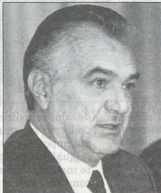
Miguel de la Madrid

registrava a entrada de 18 bilhões de dólares contra 32 bilhões de divisas exportadas). No entanto, os capitais estrangeiros preferiram investir na Bolsa e não no setor produtivo.