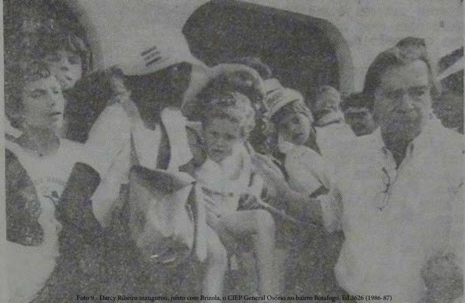
Foto 9 - Darcy Ribeiro inaugurou, junto com Brizola, o CIEP General Osório no bairro Botafogo. Ed.3626 (1986-87)