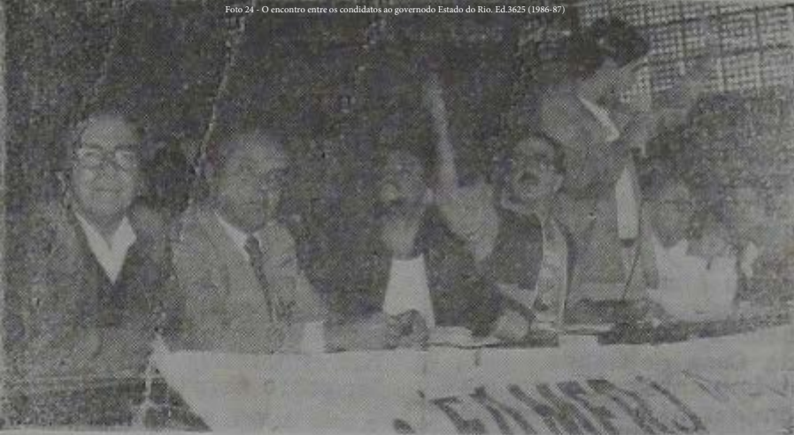
Foto 24 - O encontro entre os candidatos ao governo Estado do Rio. Ed.3625 (1986-87)