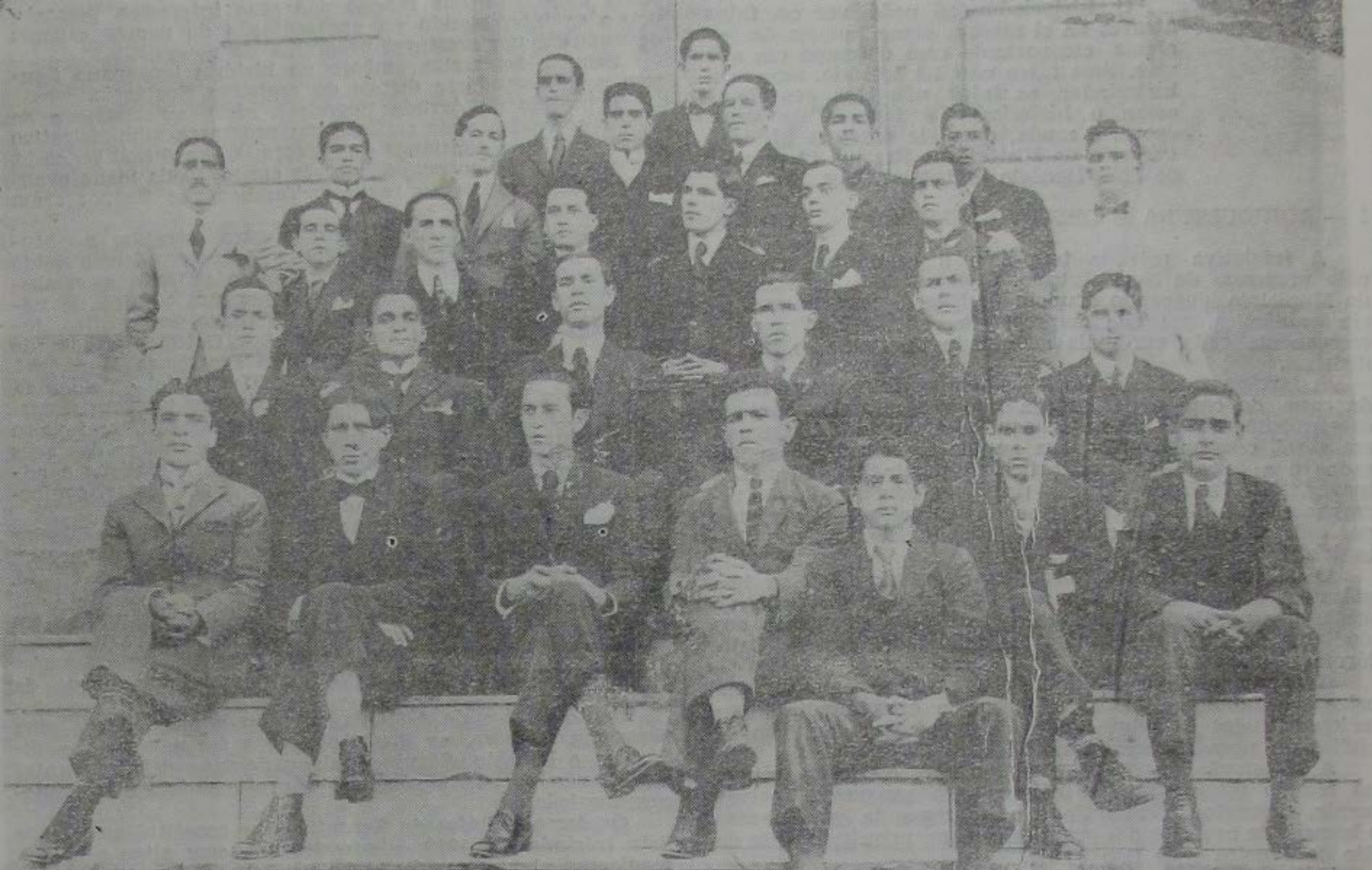
Foto 23 - Membros da sociedade iguaçuana em frente ao prédio do velho Fórum. Ed.3643 (87-88)