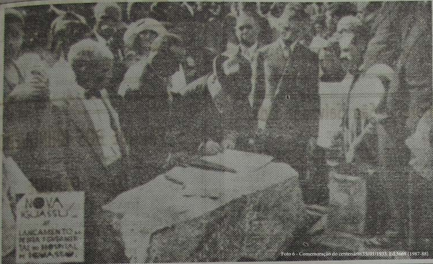
Foto 6 - Comemoração do centenário, 15/01/1933. Ed.3669 (1987-88)