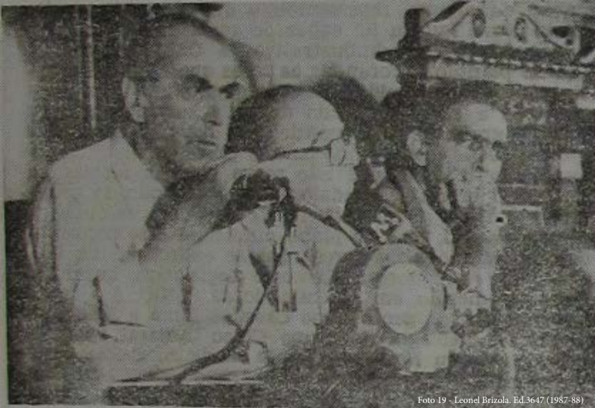
Foto 19 - Leonel Brizola. Ed.3647 (1987-88)