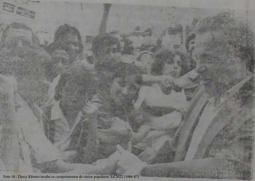
Foto 10 - Darcy Ribeiro recebe os cumprimentos de vários populares. Ed.3622 (1986-87)