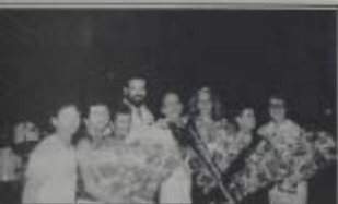
na, no Dia da Terceira Idade.