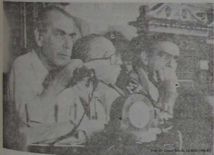
Foto 20 - Leonel Brizola. Ed.3620 (1986-87)