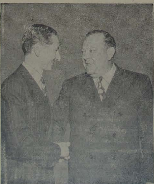
O Embaixador Nasrollah Entezam, do Iran, à esquerda, eleito Presidente da Quinta Sessão da Assembléia Geral da ONU, ora reunida em Flushing Meadows, Nova York, recebe os cumprimentos do Secretário Geral Trygve Lie.