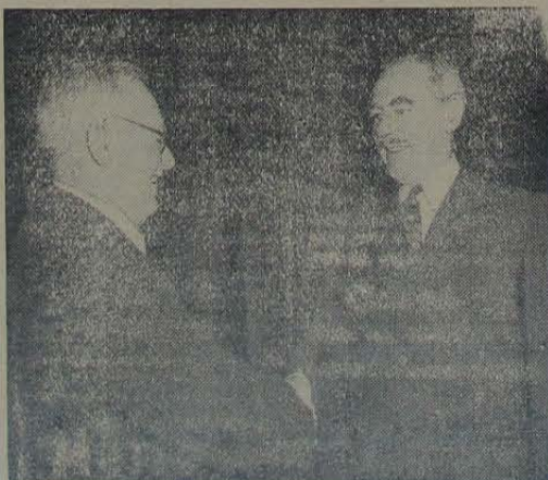
Andrei Y. Vishinsky (à esquerda), Ministro de Relações Exteriores da Russia, e Dean Acheson, Secretário de Estado dos Estados Unidos, cumprimentam-se cordialmente na inauguração do Quinto Período de Sessões da Assembleia Geral das Nações Unidas, ora reunida em Flushing Meadows, Nova York.