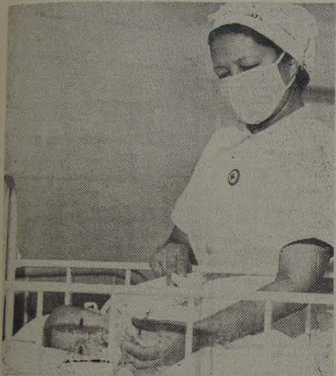
A vida deste órfão depende do leite materno, fornecido a ele pela instituição "Gota do Leite Materno", do Rio de Janeiro. Sua salvação constitui um dramático argumento em favor do "Aleitamento Materno".

Em casos dessa natureza, dizem os pediatras, só há uma coisa que pode salvar o bebê — alimentação. Isto não quer dizer alimentação artificial ou leite de vaca. Alimentação para o recém-nascido quer dizer leite materno. E na maioria dos casos como este, não se pode obter leite materno. Este órfão, porém, teve sorte. Foi colocado na lista da "Gota do Leite Materno", no Rio — uma organização fundada para tratar de casos assim. O desenvolvimento dessa criança é lento e tímido. Mas é contínuo, graças ao suprimento de leite materno que, diariamente, recebe.