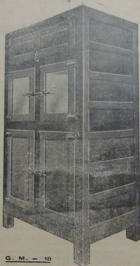
G. M. - 18