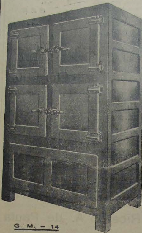
G. M. - 14