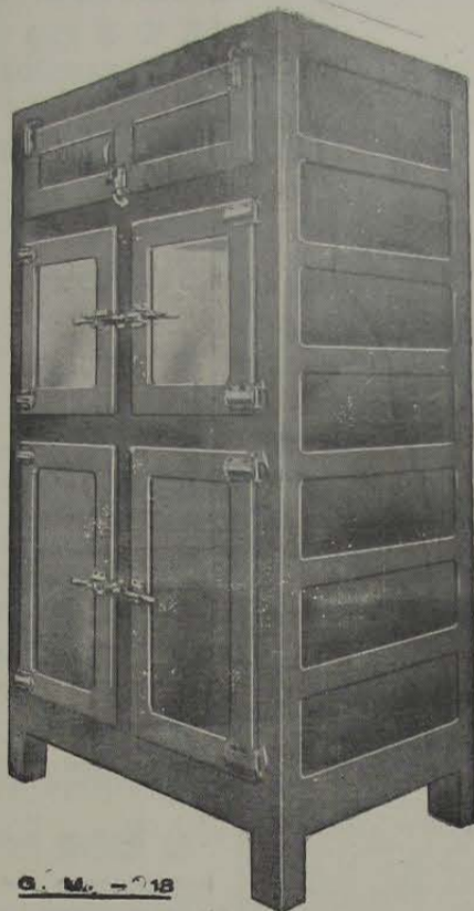
G. M. - 18