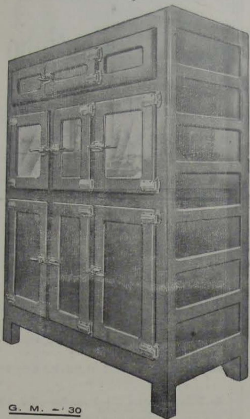
G. M. - 30