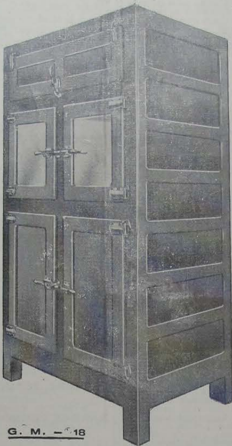
G. M. — 18