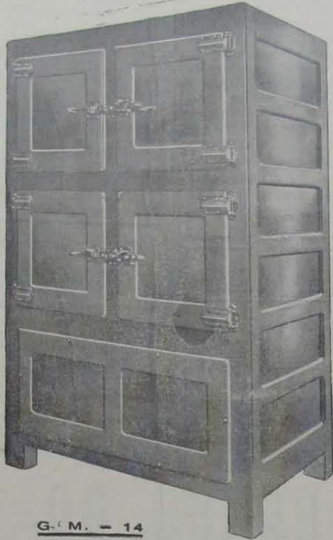
G. M. - 14