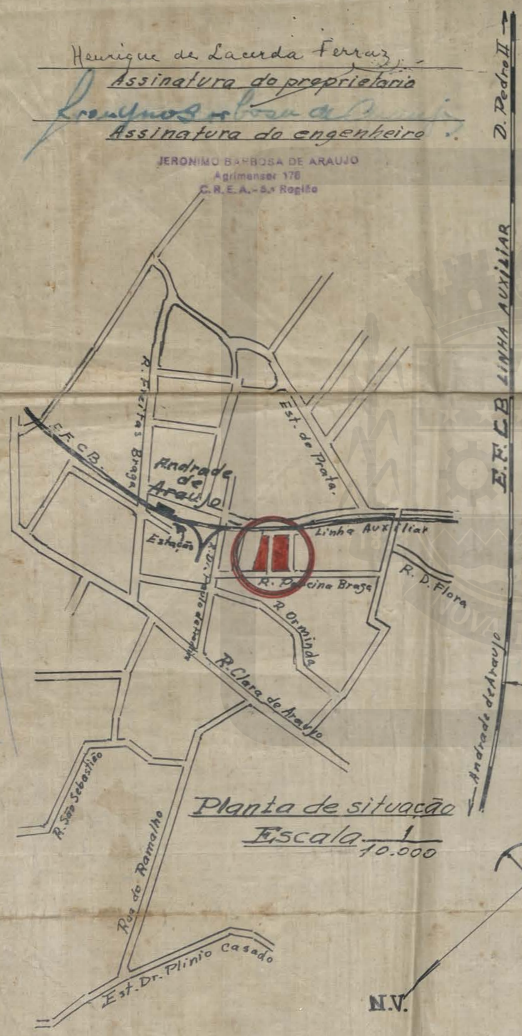
Planta de situação Escala 1/10.000

P. M. N. I. ARQUIVO DA D. E. PLANTA Nº 28/52