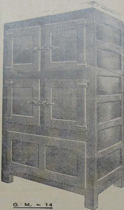
G. M. - 14