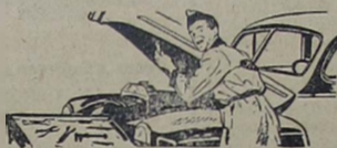
3 - Ferramentas especiais para o Ford que facilitam o serviço, poupando tempo.