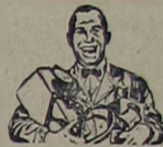
4 - Peças Ford legítimas que se ajustam com precisão e duram mais.