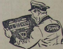
2 - Métodos aprovados pela fábrica que diminuem o custo do serviço.