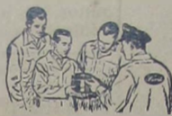
1 - Mecânicos Ford especializados que conhecem seu Ford de "fio a pavio".

E o protegemos melhor do que ninguém, porque, como revendedores Ford, só nós podemos oferecer: