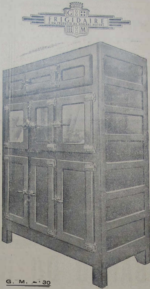
G. M. 30

Vende-se um lote de terreno, na rua Floresta Miranda. Tratar à rua Antonio Carlos, 245.