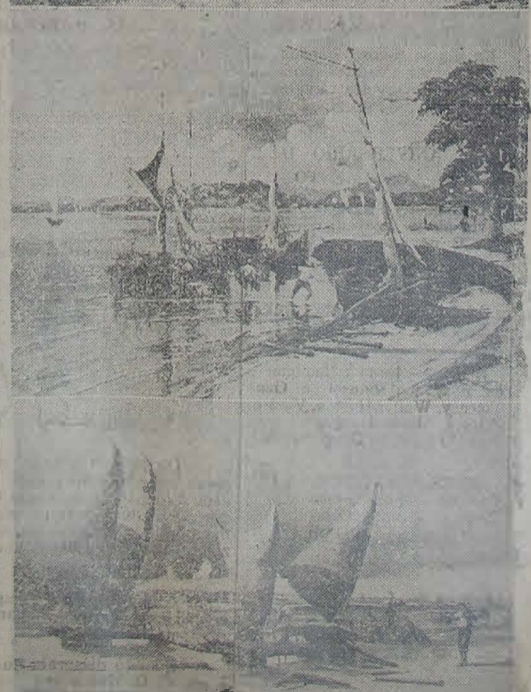
Três trabalhos de J. Carvalho que, embora focalizando praias do Norte e do Sul, guardam o traço personalíssimo do artista. Em cima, "Trecho de praia" (Paraitiba); ao centro, "Zumbi" (Ilha do Governador), e, em baixo, "Farol do Mucuripe" (Ceará), tela que alcançou amplo sucesso na exposição de J. Carvalho, em Montevideu.