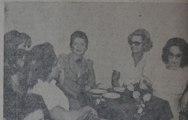
Uma das mais animadas mesas durante o chá promovido pelas domadoras do Lions Clube de Nova Iguaçu.