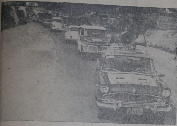
Aspecto parcial da caravana do Senador Paulo Torres quando percorria o município de Nova Iguaçu