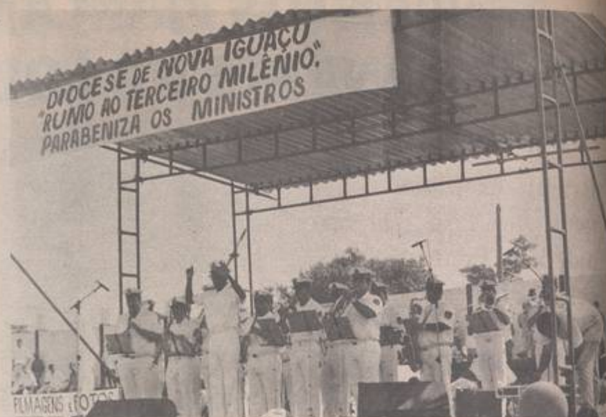
Banda dos Fuzileiros Navais do Rio de Janeiro, que executaram o Hino Nacional e a Música Jesus Cristo, de Roberto Carlos.