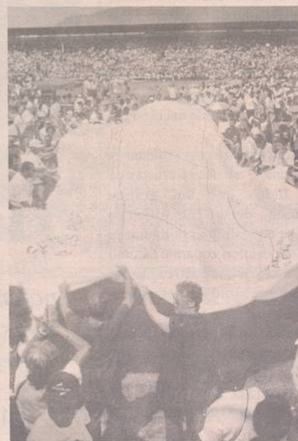
A Região IV fez sua apresentação através de quatro alas com quatro panôs, que retratavam o tema da CF-97 e a realidade dos encarcerados em nosso país; os desafios para a Evangelização, como o

respeito a cultura e a tradição do povo e a necessidade do trabalho Ecumênico em defesa da vida; a pesquisa sócio-religiosa (na foto) e a vista às casas.