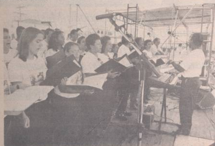
Apresentação do Coral Amanhecer