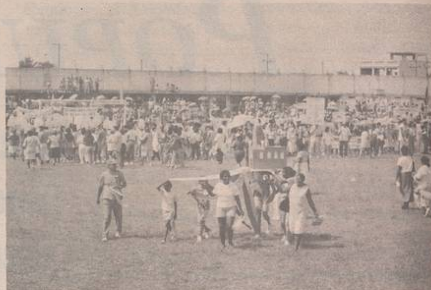
A Região III apresentou o Tempo da Pré-Missão, mostrando a importância da preparação para as Missões com a convocação do Bispo Diocesano, o cartaz das Missões, a preparação das paróquias e o lançamento das Santas Missões Populares, no mês de outubro na Catedral Santo Antônio. Na (foto acima) uma maquete da Catedral, nossa Igreja Mãe.