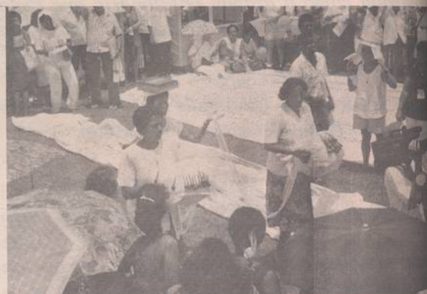
Entrada da Bíblia com elementos da cultura nordestina.