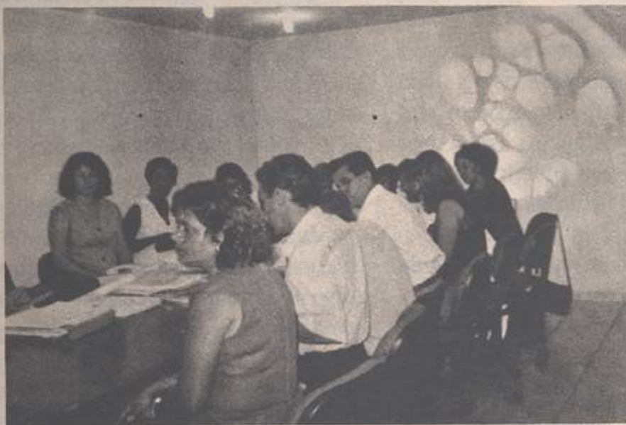
Flagrante da Posse do Conselho de Educação de Nova Iguaçu

Hoje podemos dar a notícia que no dia 21 de novembro de 1997, finalmente, foi empossado o Conselho Municipal de Educação, pelo Prefeito Nelson Bornier.