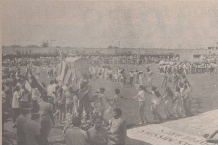
Região I apresentando uma coreografia do Hino das Santas Missões Populares, acompanhada com a Imagem de Santo Antônio.