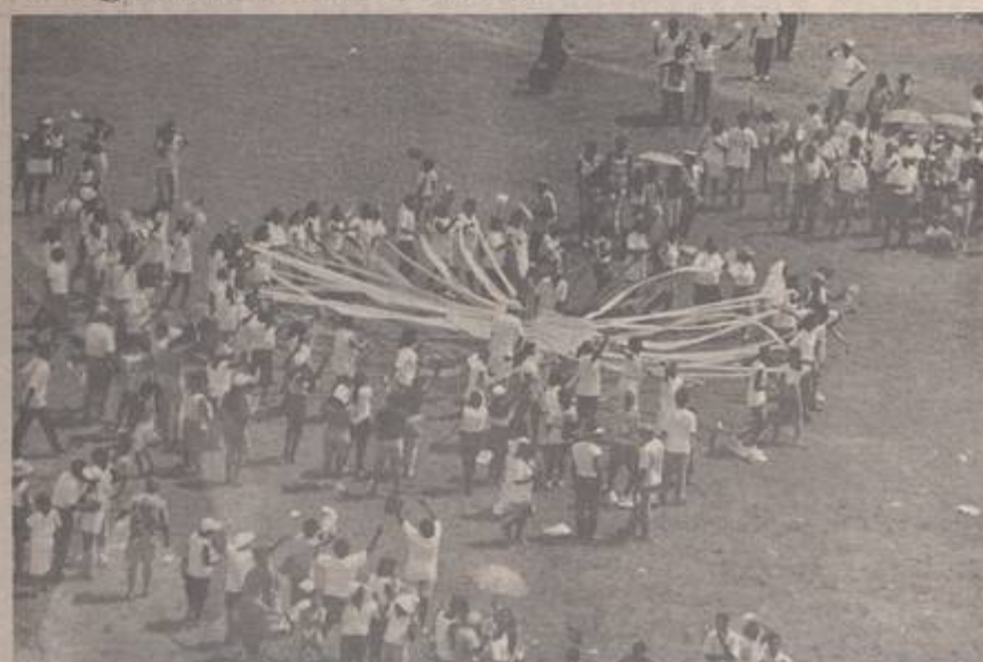
A Região II apresentando a Nucleação, recordou o mês de Maio com a Imagem de N. S. Aparecida no meio e fitas das nove paróquias, formando um círculo.