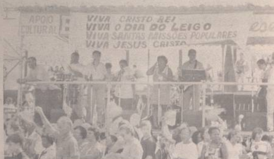
Equipe de animação que motivou a Celebração Missionária.