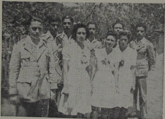
Grupo dos bacharelados de 1941, do Ginásio Leopoldo

Os Gremio Pedro II e Duque de Caxias com suas valorosas equipes de vôlei-bol, cestobol, pingue-pongue e xadrês, têm demonstrado, por varias vezes, sua pujança e cavalheirismo, na disputa amistosa com equipes e colegios de S. Paulo,