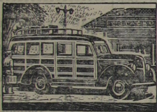
Opção entre motores de 95 e 85 cavalos, ou motor Hercules-Diesel.

No instante em que adquirir um caminhão Ford, o senhor começará a fazer economia. Economia em trabalho, porque Ford transporta maiores cargas... economia em dinheiro, porque Ford proporciona surpreendente rendimento... economia em tempo, porque Ford é extremamente veloz. Por isto Ford é o caminhão preferido em todo o Brasil; por isto deve ser, também, o seu caminhão. Experimente um Ford, no trabalho: admire sua potência, constate seu rendimento, verifique sua capacidade. Escolherá um Ford.