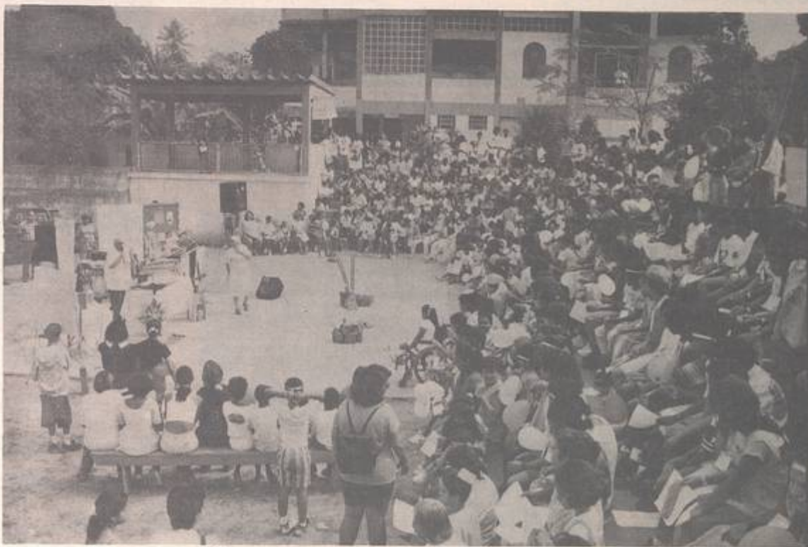
"Celebração das Crianças", Comunidade N.S. Aparecida, Paróquia Santa Rita, Cruzeiro do Sul, as crianças receberam um cordão com a cruz, como símbolo da missão, tomando-se assim, missionários.