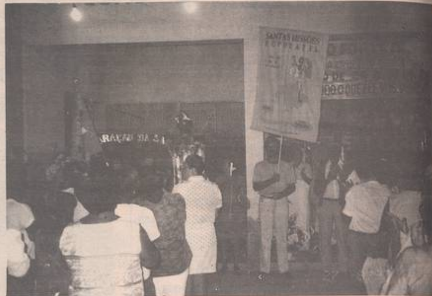
"Celebração da Saudade" na Comunidade Nossa Senhora da Glória, onde homenageamos as pessoas falecidas que muito colaboraram na construção das comunidades.

O encerramento do "Tempo Forte das Missões", aconteceu durante a Santa Missa, que contou com a participação de cerca de 1000 pessoas.