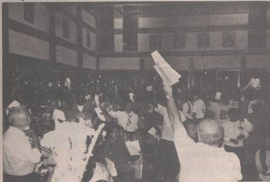
"Celebração das Famílias", na Comunidade São José operário onde cada família recebeu uma rosa ofertada pela Comunidade.