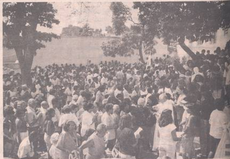
Missa de Encerramento do Tempo Forte, na Paróquia Santa Rita, com a participação de cerca de 1000 pessoas.

Na homilia, Pe. Arnaldo destacou que as Missões não terminavam com a Missa, e sim continuavam com a atuação dos missionários na sua tarefa de evangelizar cada dia mais, colocando em prática todos esses momentos fortes vividos nesta semana.