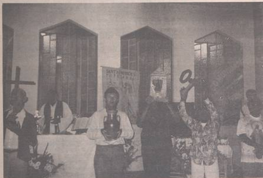
"Celebração do Perdão", na Comunidade de São Francisco de Sales, onde cada pessoa recebeu de lembrança um frasco de água benta, simbolizando o Perdão.