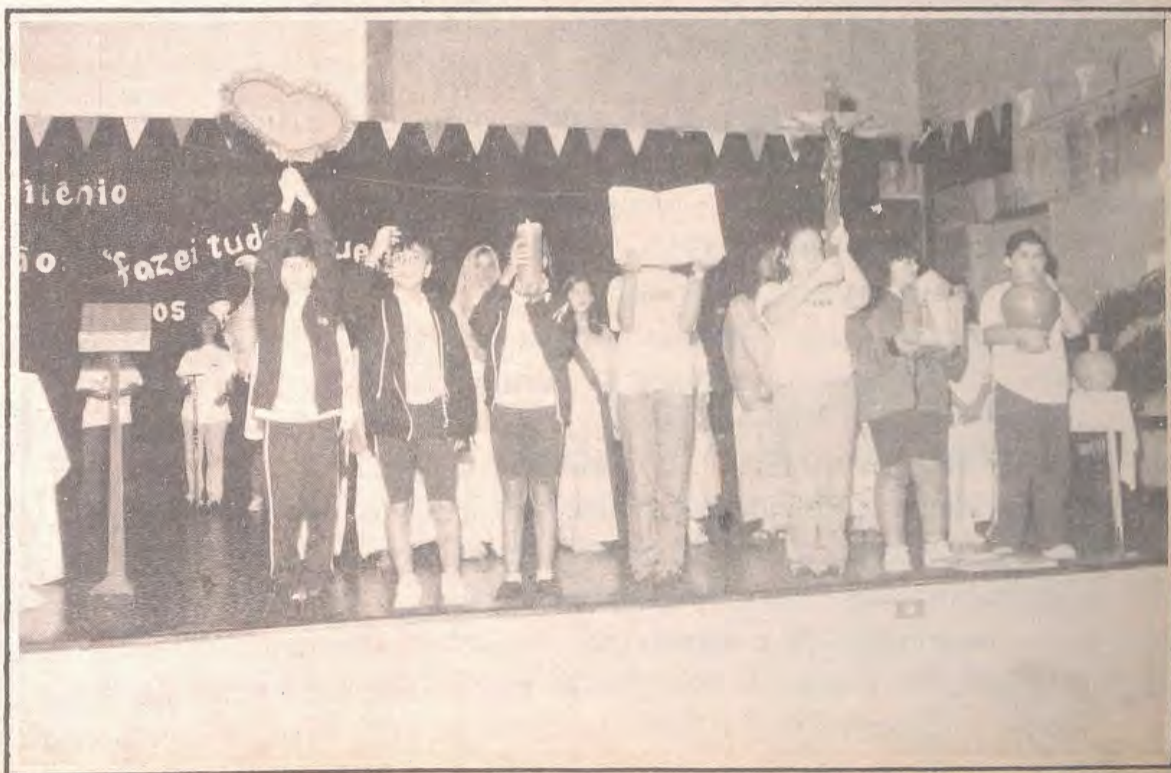
Celebração das Missões no IESA, no dia 05 de junho, com 3.000 alunos e 180 professores