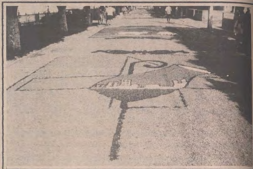
Tapete da celebração de Corpus Christi em Paracambi