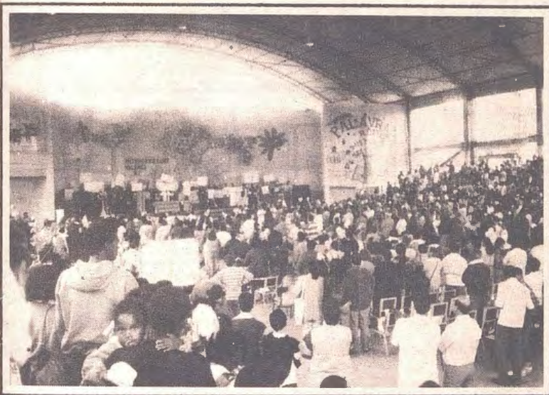
Cinco Dioceses do Rio de Janeiro se fizeram presentes em Valença, preparando o 9º Encontro Intereclesial no Maranhão