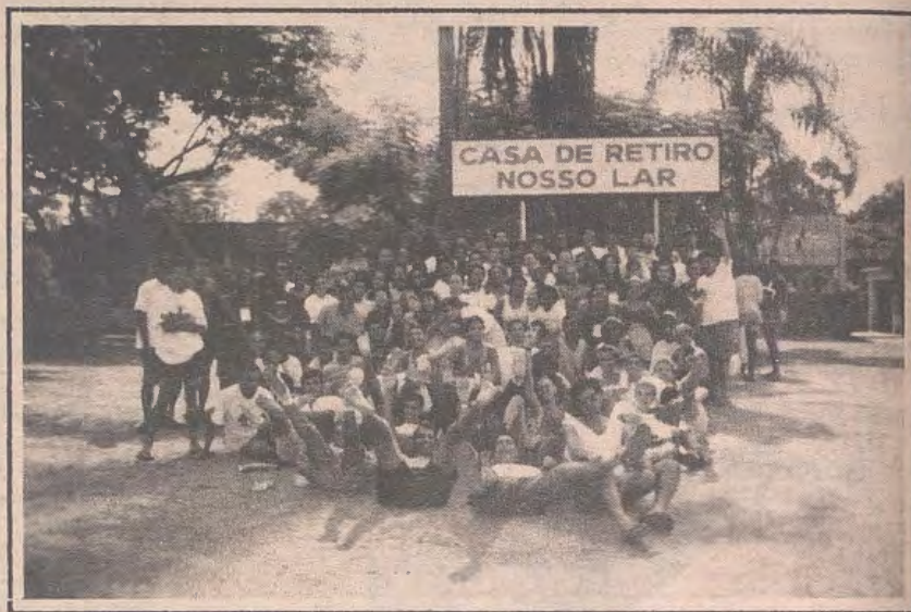
1º Seminário de Oficinas da Pastoral da Juventude "Nosso Lar"