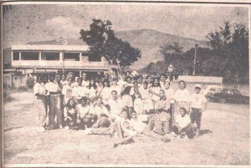
Pastoral da Juventude - PARÓQUIA N.ª DA CONCEIÇÃO - ROSA DOS VENTOS.

Há quatro meses iniciamos o Curso de Capacitação para Coordenadores e Líderes, na nossa paróquia. Esse tempo de formação foi agradável e instrutivo. Nossos Jovens, seguiram os Cursos com muito interesse e firmeza, aproveitaram também para descobrir o valor de ser Jovem cristão e praticante.