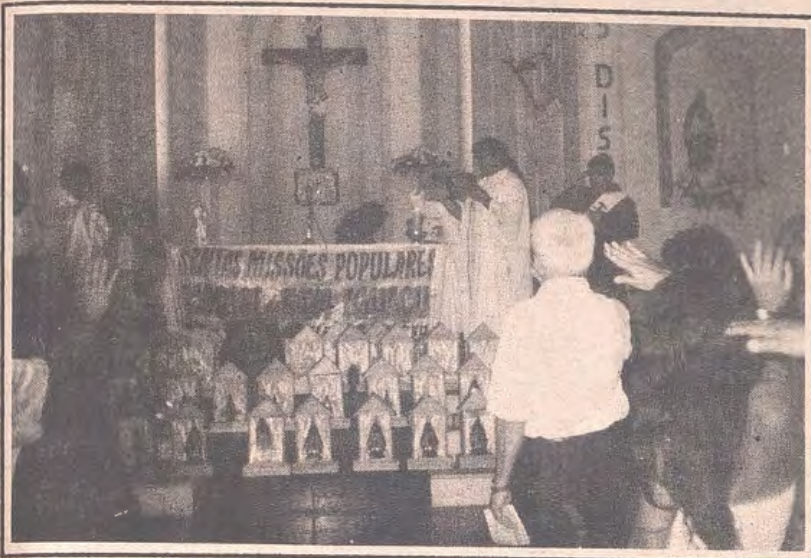
Envio dos Missionários e das Capelinhas, da Paróquia Nossa Senhora da Conceição, Nilópolis