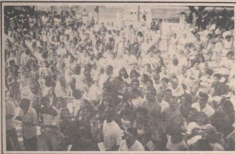
1º DE MAIO

(Café e almoço - p a r t i l h a d o ) Participe!