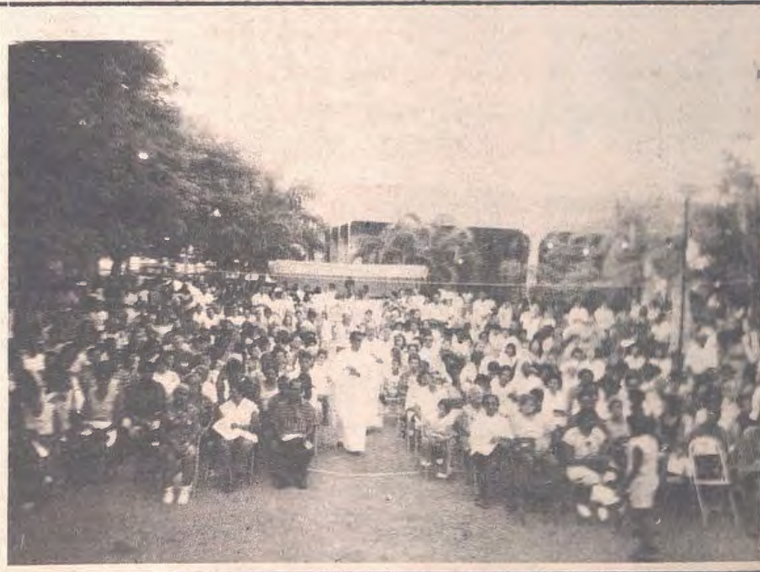
Durante a Gincana foi celebrada a Santa Missa com a participação do povo.

Agradecemos a todos os regionais, pela ajuda e colaboração.