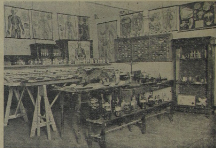
SALA DE HISTORIA NATURAL