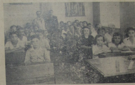
SALA GENERAL ERNESTO CARLOS CEZAR Grupo de alumnos do Curso Propeedeutico e Auxiliar do Comercio

Movimento de janeiro de 1937: Existiam em tratamento 41 pessoas; presenciam o serviço, 97; mordidas por cães raivosos, 34; idem, por gatos raivosos, 6; idem, por cães e gatos suspeitos, 87; completaram o tratamento, 70; abandonaram o tratamento, 20; existim em tratamento, 18; injecções applicadas, 810; casos de insucesso, 0; animais vacinados, 41.