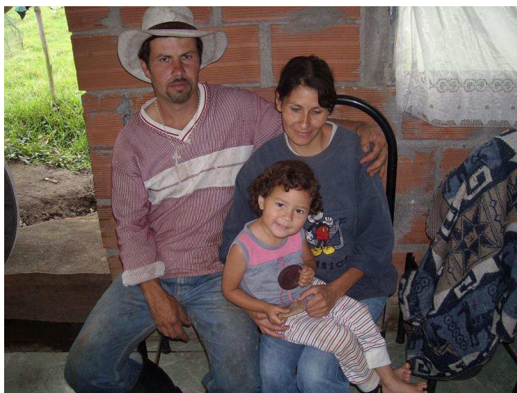
Pai, mãe e filha mais nova durante período de descanso do pai ocupado no próprio cultivo de café. Nessa manhã, os outros dos filhos do casal estavam na escola.

Com algumas exceções, as famílias de pequenos produtores contam na casa das chácaras com serviços de luz e água potável. A telefonia celular é o meio mais usado e acessível de comunicação. Como obras de bem-estar social, a Federação Nacional de Cafeeiros 5 , em coordenação com a administração municipal, desenvolve jornadas de saúde e patrocina a construção e dotação de escolas, aquedutos, infraestrutura de esgotamento sanitário, caminhos, estradas e obras de