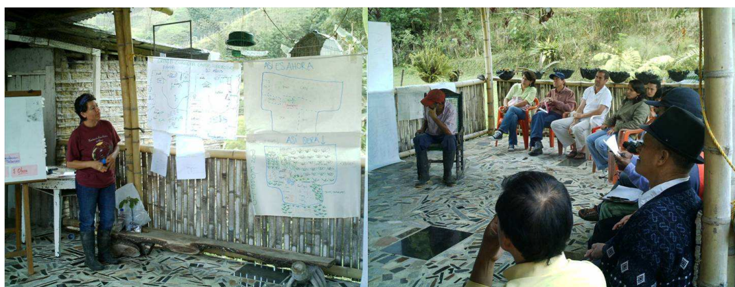
Membros da comunidade de El Arenillo discutem acerca dos possíveis projetos coletivos em torno da “agroecologização” do seu espaço de vida.

Mormont (1987) contribui para essa análise quando afirma que, além do rural ser reivindicado como um espaço passível de apropriação (neste caso apropriado como cenário físico para instaurar projetos produtivos ecológicos e sustentáveis), também pode ser simultaneamente acolhido como aquele no qual é possível desenvolver uma forma alternativa de vida ou um modelo alternativo de sociedade oposto ao dominante no mundo contemporâneo. Nesse caso, seu uso comercial, apropriação orientada por critérios agroecológicos e valores afins a uma economia de ordem moral, seria diferente daquele totalmente centrado na procura de lucro. Neste sentido, como propõe Escobar (1999), para que uma cultura ecológica possa ser assumida como a base de uma proposta econômica e tecnológica própria (o que implica que a natureza não seja reduzida a mercadoria sobre o signo de ganho), os grupos sociais teriam que desenvolver formas de democracia ambiental e esquemas participativos de planejamento e gestão, que lhes permitisse construir identidades coletivas e definir modos de relação alternativos entre natureza e cultura, como seria o caso acontecido na comunidade El Arenillo. A experiência relatada daria conta de uma comunidade, até certo ponto autônoma, promovendo projetos alternativos no contexto local, fundamentados numa forma particular de conceber as relações homem, natureza e sociedade, orientada e informada pelo pensamento agroecológico.