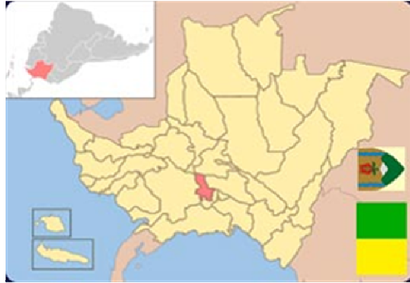
Localização do Estado de Caldas, Colômbia