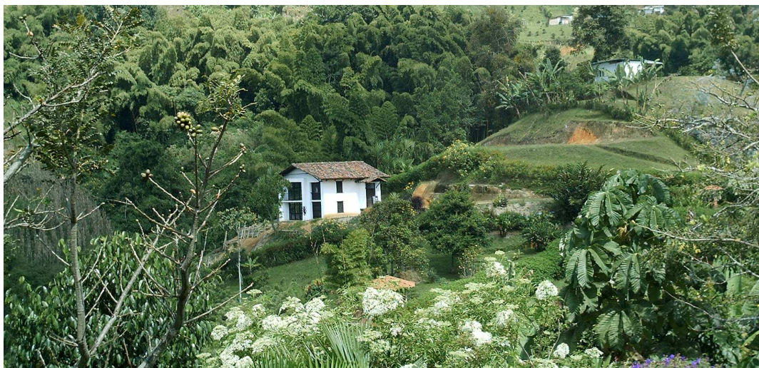
Figura 7. Detalhe de casa localizada num condomínio rural em Manizales

Na imagem destaca o uso habitacional dado ao espaço rural. O condomínio, as casas rodeadas de muita vegetação, somam-se ao paisagem rural.