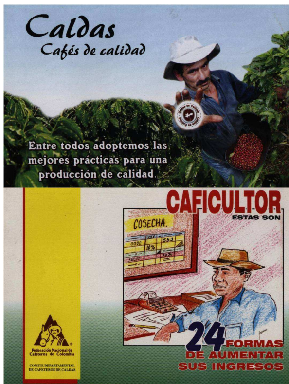
Figura 4. Capas de publicações editadas pelo Comitê de Cafeeiros de Caldas, direcionadas a agricultores familiares

Em ambos os folhetos enaltecem valores produtivistas, associados ao incremento da produtividade e a competitividade dos pequenos produtores, afins a lógica que orienta a ruralidade hegemônica.