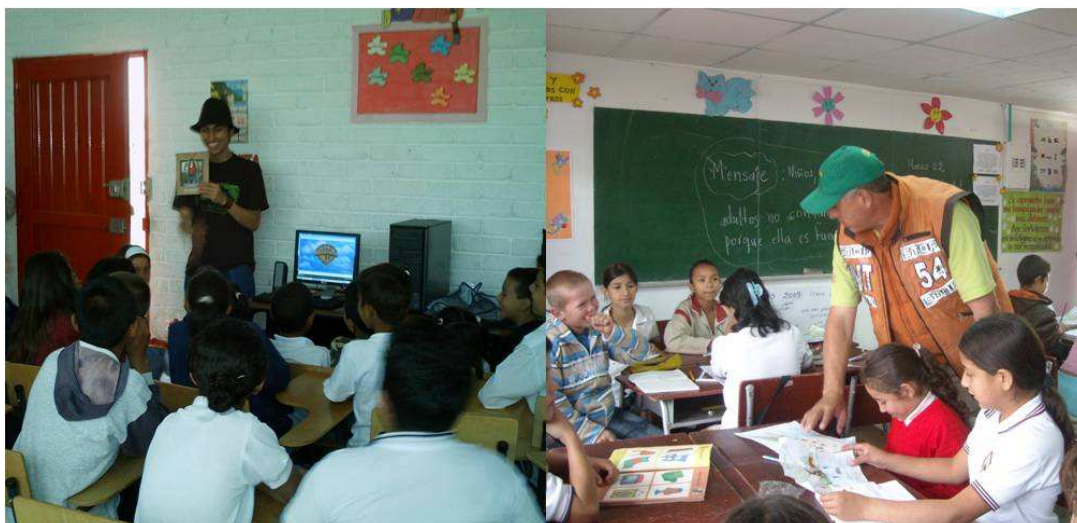
Figura 10. Crianças, filhas de agricultores familiares, tomando aulas numa das escolas rurais de Manizales

Para os filhos de agricultores familiares, ir a escola faz parte do seu cotidiano, oportunidade geralmente negada aos pais na sua infância.