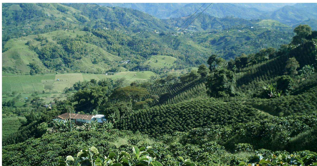
Figura 3. Paisagem típica cafeeira

Paisagem de montanha, com ladeiras principalmente cobertas de plantações de café. No fundo, casa de habitação e benefício de café de agricultores familiares.