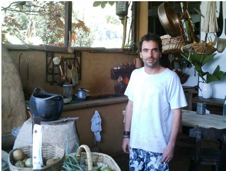
Figura 6. Neo-rural na sua casa na zona rural de Manizales

Para este neo-rural, morar no campo represente uma forma de “fugir da agitada vida na cidade, dos horários rígidos, da paisagem cinzenta”.