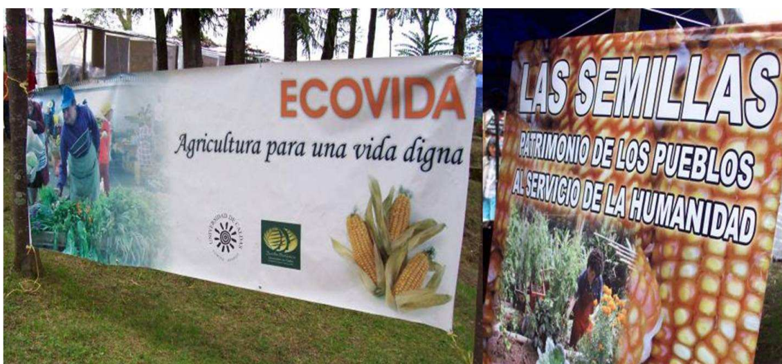
Figura 5. Avisos publicitários do evento ECOVIDA-2008

Ambos os cartazes exaltam princípios e valores afins a lógica que orienta a ruralidade contestatória, neste caso relacionados a agricultura como atividade para além do mero produto produtivo