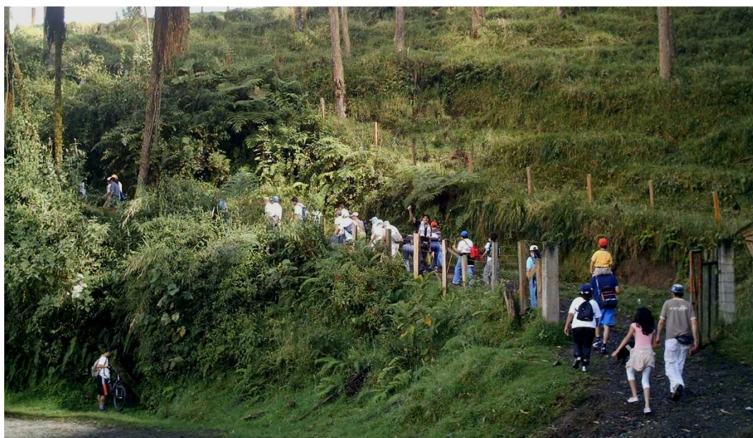
Figura 8. Grupo local de caminhantes numa manhã de domingo

Pessoas de diferentes idades fazem uso recreativo dos espaços rurais locais.