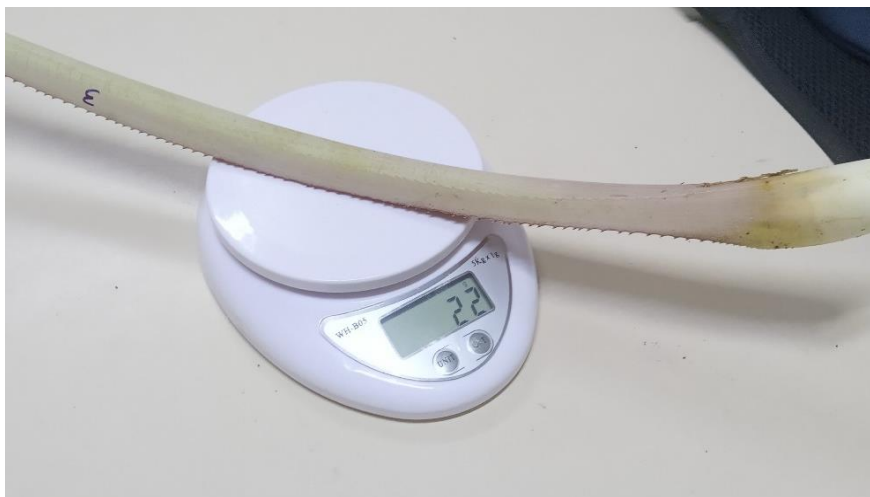
Figura 5: Pesagem da folha 'D' do abacaxi 'Turiaçu' para aferição da Massa Fresca (MF), utilizando balança digital com determinação do peso em gramas.

As folhas pós colhidas, foram pesadas imediatamente para mensurar sua massa fresca (MF). Em seguida, utilizando-se uma trena, foram realizadas as aferições de comprimento e largura. Concluída as mensurações anteriores, tais folhas foram postas em estufa de circulação forçada, com temperatura regulada em 65 °C, por um período de 72 horas (MELO et al., 2013) para que então, ocorresse a mensuração da massa seca.