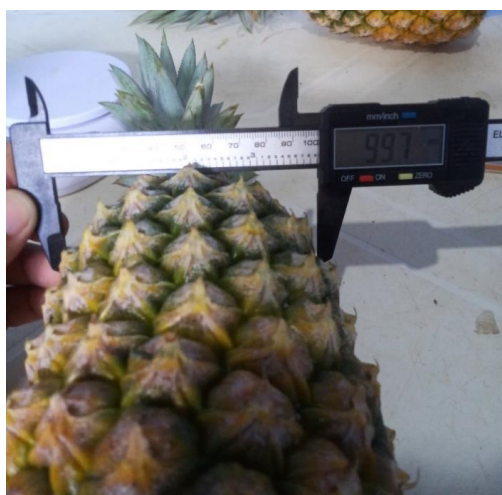
Figura 8: Aferição do diâmetro do ápice do fruto do abacaxi ‘Turiaçu’, utilizando parquímetro digital com denominação da medida em milímetros - mm.

As conferências do diâmetro na base do fruto se deram a uma distância de aproximadamente 2 cm da extremidade onde o fruto se une ao pedúnculo da planta; o diâmetro apical, se deu a aproximadamente 2 cm da inserção da coroa.