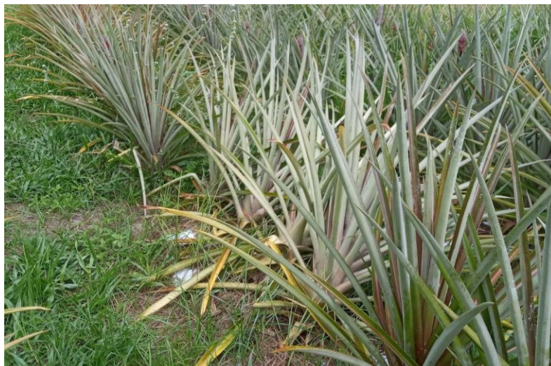
Figura 9: Tombamento de plantas adultas do abacaxi ‘Turiaçu’ em tratamento com cobertura do solo feita com mulching plástico.

Finalizando as análises do cultivo, cabe ressaltar que não foram detectados problemas de fusariose ( F. subglutinans ) nas plantas, frutos ou nas mudas. Também não foi observado incidência de frutos com rachaduras ou fasciação.