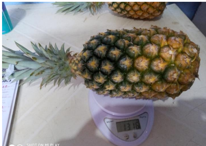
Figura 7: Aferição do peso do fruto com coroa (PFCC) do abacaxi ‘Turiaçu’, em balança digital com especificação do peso em gramas.

Sobre a avaliação do peso do fruto (figura 6), recorreu-se ao mesmo equipamento utilizado para determinação da MF e MS da folha D. A pesagem do fruto com coroa, se deu prontamente à colheita. Já a pesagem do fruto sem a coroa, se deu após este ser mensurado e determinado seu comprimento com coroa.