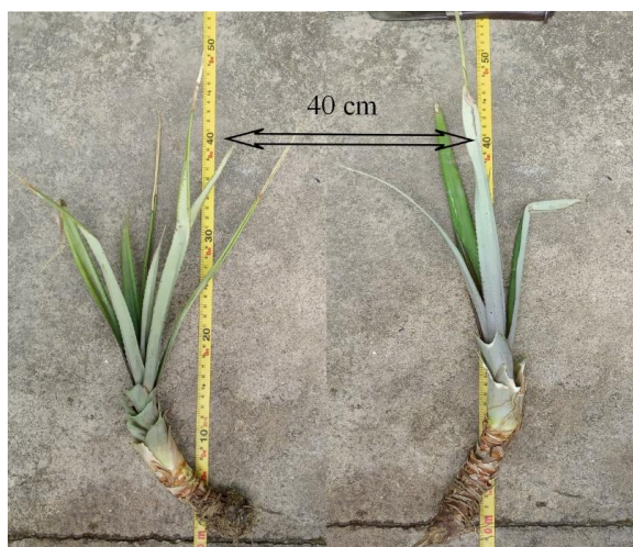
Figura 1: Aferição do tamanho e aspecto das mudas tipo filhote do abacaxi ‘Turiaçu’, durante o processo de seleção delas para posterior plantio e implantação do experimento.

Para determinar o comprimento da muda, a aferição se deu medindo do caule, parte onde a muda se prende a planta mãe, à ponta da folha mais comprida.