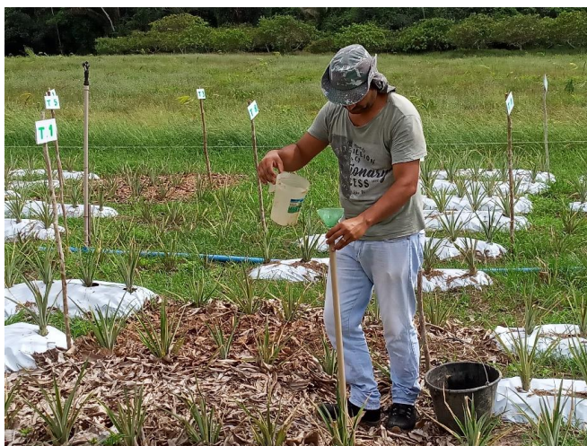
Figura 4: Aplicação do biofertilizante nas folhas basais do abacaxizeiro ‘Turiaçu’ no tratamento 3 (serrapilheira + biofertilizante a cada 14 dias), quando as plantas estavam com 60 dias após o plantio (DAP).

A serrapilheira utilizada no experimento foi coletada em área de vegetação nativa, área de mata, localizada no entorno do Setor de Fruticultura do IFMA, onde o experimento foi realizado. O volume de serrapilheira utilizado por parcela, dos tratamentos em que se usou tal material, foi de 0,27 m 3 ou 270 l. Considerando que cada parcela tinha área de 5,4 m 2 , implica dizer que, para um hectare de cultivo, a necessidade de serrapilheira é de 500 m 3 , o que equivale a 500.000 l de serrapilheira.