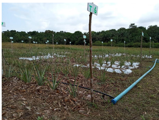
Figura 3: Vista parcial do experimento 70 dias após o plantio do abacaxi cv. ‘Turiaçu’, tendo em primeiro plano uma parcela do tratamento (T6) apenas mulching de serrapilheira e logo atrás o (T2) Mulching plástico + serrapilheira sob o mulching plástico + biofertilizante a cada 14 dias.

O plástico utilizado como mulching foi a lona dupla face, lado preto e outro branco, de 180 micras. Cortadas em tamanhos 2 x 1 m, de modo que cobriu o comprimento da fileira, nas parcelas, e cerca de 50 cm para as laterais de cada fileira de plantio. Na Figura 3 observa-se parcialmente o experimento 70 dias após o plantio