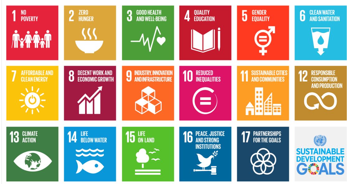
Figura 1 - 17 Objetivos de Desenvolvimento Sustentável