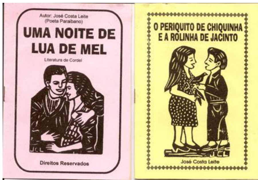
Figura 1: Exemplo de xilogravura