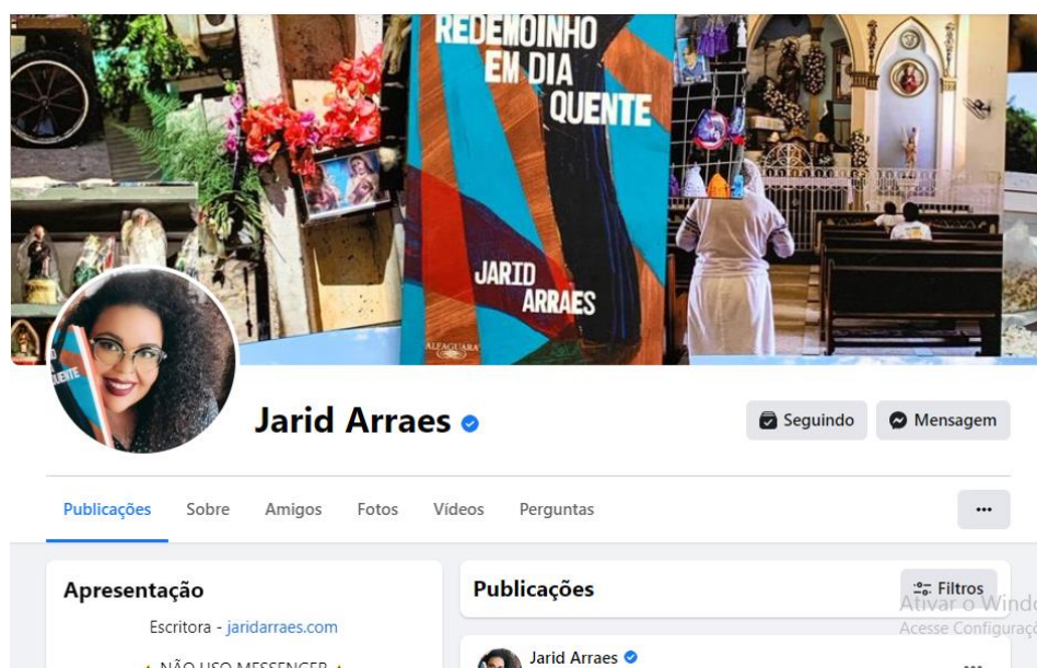
Figura 4: Imagem capturada da página inicial do Facebook de Jarid Arraes

Disponível em: https://www.facebook.com/arraesjarid