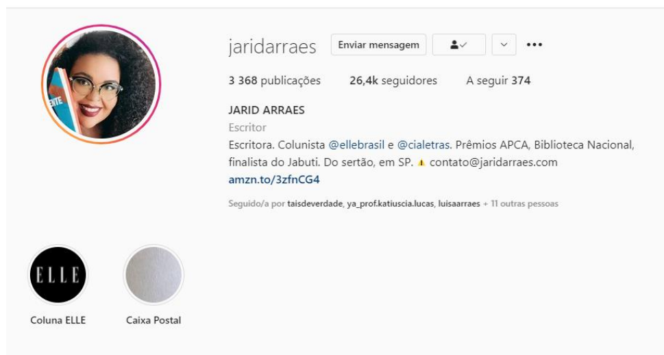
Figura 3: Imagem capturada da página inicial do Instagram de Jarid Arraes

Disponível em: https://www.instagram.com/jaridarraes/