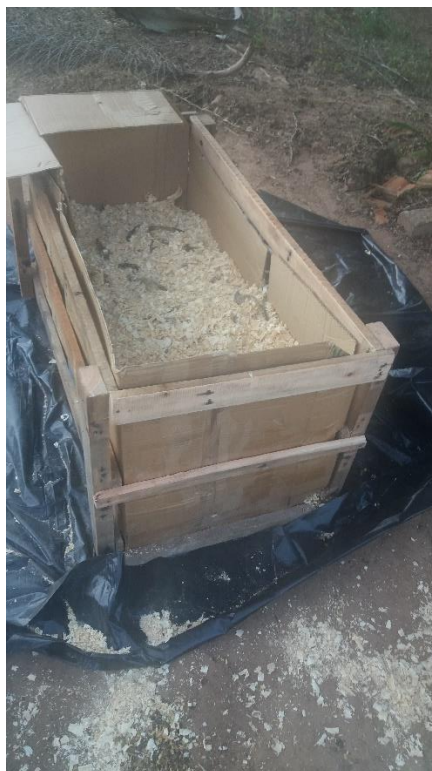
Figura 1: Molde em madeira.