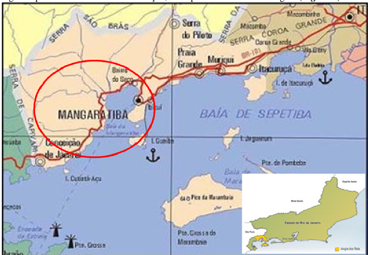
Figura 2: Localização geográfica da propriedade rural, na região de Mangaratiba-RJ, onde foi realizado o estudo

A propriedade possui 700 alqueires, dos quais 350 de mata atlântica preservada e os 350 restantes constituem pastos divididos por cercas elétricas nas divisões interna e arames farpados nas divisões externas. Os pastos são cultivados com braquiarias ( decumbens , brizantha ) e capim colômbio ( Panicum Maximum ). Possui dois currais de ordenha, sendo o primeiro para vacas recém paridas, onde permanecem até sessenta dias de lactação e o segundo para as demais vacas em lactação, onde permanecem até a secagem ( Figura 2 ).