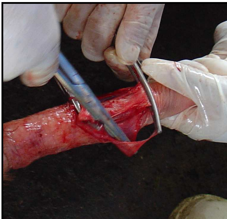
Figura 7: Pênis bovino: Segmento do LADP a ser extirpado, pinçado por duas pinças hemostáticas formando os limites a serem seccionados.

Durante todo o procedimento cirúrgico, o pênis foi mantido exposto, tracionado por um auxiliar da equipe, por meio da mesma amarradura de crepom. Foi realizada uma incisão longitudinal, no local pré-definido anteriormente e previamente anestesiado, com o auxílio de bisturi de lamina. Em seguida foi realizada a dissecação da túnica albugínea utilizando tesoura de ponta romba e pinça dente de rato e após a visualização do LADP e definido o ponto de clivagem, o ligamento foi cuidadosamente separado do corpo do pênis através de dissecação com tesoura de ponta romba, ficando a tesoura entre o corpo do pênis e o LADP. A extremidade distal não aderida do ligamento foi pinçada com pinça hemostática Kelly e a partir de então foi realizada a medida de cinco centímetros, sentido proximal onde foi fixada outra pinça do mesmo modelo. Neste momento, a porção a ser extirpada já está definida ( Figura 7 ). Foi realizada a secção das extremidades pinçadas obtendo-se assim a extirpação de cinco centímetros do LADP.