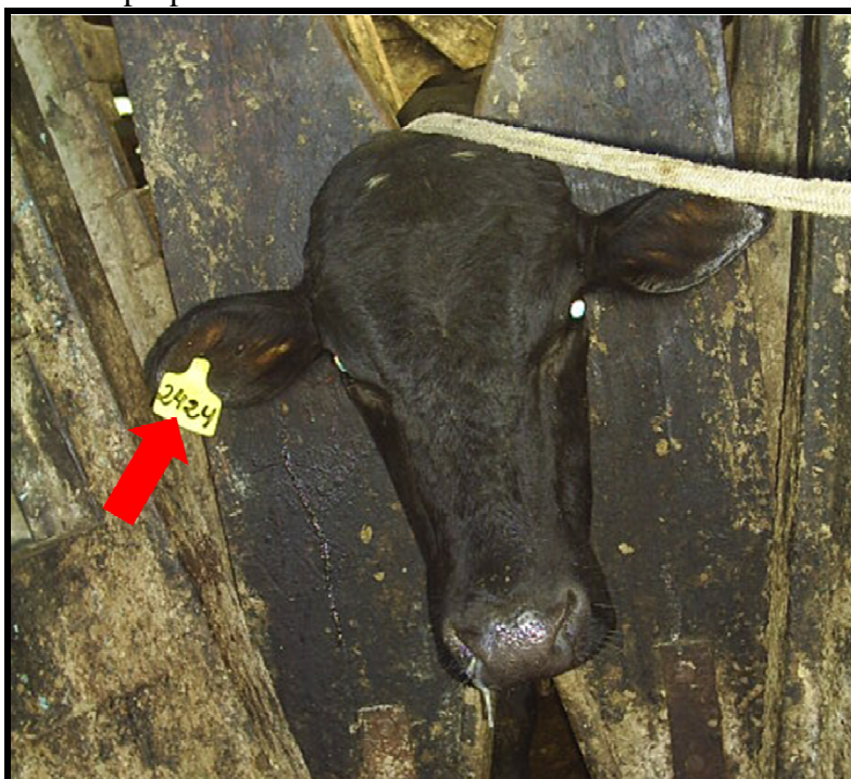
Figura 3: Identificação por brinco de animal nascido na propriedade

O sistema de rastreamento dos animais consiste na utilização de brincos amarelos numerados, para animais nascidos na propriedade, de acordo com o nascimento ( Figura 3 ). Para animais adquiridos de outrem, os brincos são de coloração vermelha, seguindo a ordem de aquisição. Além dos brincos, os animais são marcados a ferro quente com a mesma numeração constante no brinco, seguida da letra “B”, para os nascidos no local e letra “O” para os adquiridos de outras propriedades.