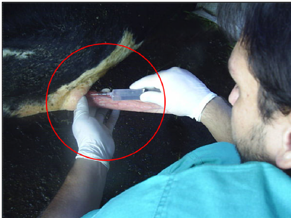
Figura 6: Procedimento de infusão de lidocaína na região dorsal do pênis bovino ao longo do local de incisão

A anestesia foi realizada através de bloqueio local com lidocaína 2,0%, com vaso constritor, na região dorsal do pênis destinada à incisão cirúrgica, até a formação do “botão anestésico”, que corresponde ao aumento de volume local provocado pela infusão de lidocaína no tecido ( Figura 6 ). O local da incisão cirúrgica foi definido através da obtenção, com o auxílio de uma régua, da distância entre a região mais proximal da glândula à rafe do prepúcio, reproduzindo esta mesma distância, a partir da rafe do prepúcio em sentido distal à glândula. Este local, de acordo com o estudo prévio realizado com peças anatômicas, corresponde ao ponto de menor densidade do LADP, sendo então o local ideal para a incisão.