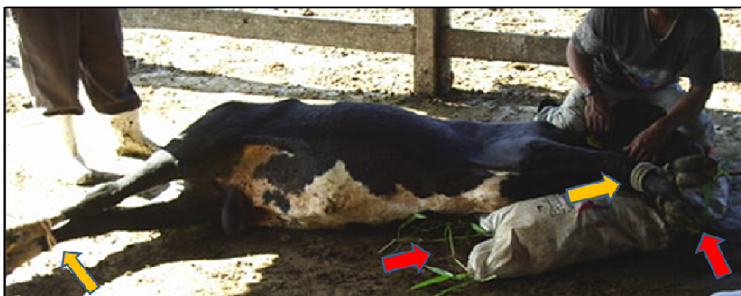
Figura 4: Bovino contido em decúbito lateral; Seta amarela - Contenção física por cordas mantendo os membros estendidos; Seta vermelha - Acolchoamento de sacos de ráfia repletos com capim para membros dianteiros e cabeça.

Depois da aplicação dos sedativos, os animais foram conduzidos até uma área coberta do curral de manejo. Após atingido o efeito desejado das drogas utilizadas, foi realizada a contenção física por cordas, mantendo o animal em decúbito lateral direito, com os membros estendidos. Para a proteção da cabeça e membro dianteiro, foi feito um acolchoamento local, utilizando sacos de ráfia repletos de capim ( Figura 4 ).