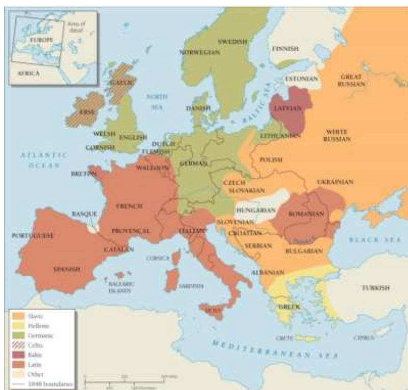
1Figura: Mapa Etnolinguístico da Europa em 1848