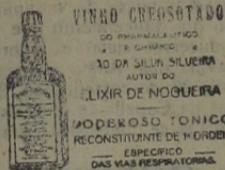
VINHO CREMOSADO DO PRINCIPAL VITICULTOR DO BRASIL... LIXIR DE NOGUEIRA... PODEROSO TONICO RECONSTITUENTE DE NORDEN... ESPECIFICAMENTE DAS VIAS RESPIRATORIAS.

O governo paulista e o federal têm suas vistas voltadas para esse problema, que deve ser quanto antes resolvido, pois que a continuação de tal abuso importa em grande prejuizo para o Brasil.