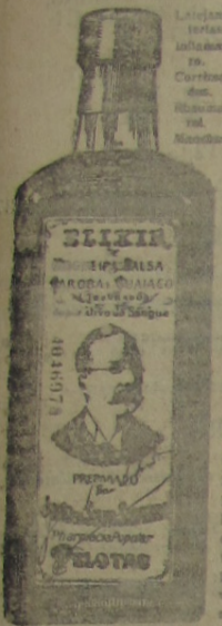
GRANDE DEPURATIVO DO SANGUE