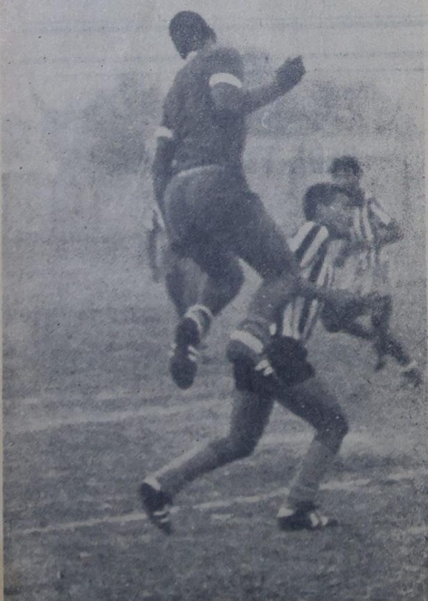
Fase do treino da seleção de Nova Iguaçu, no Estádio do Carmari