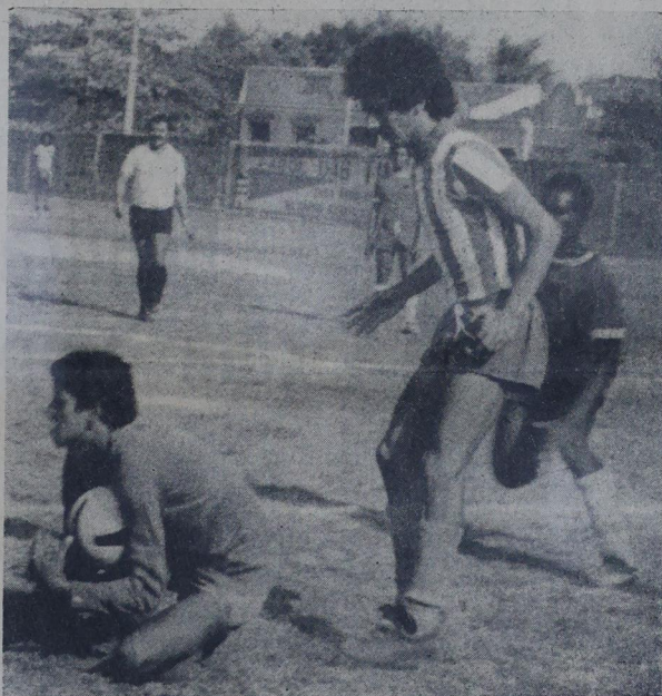
O juvenil do Heliópolis acompanhou o time principal: venceu, também, por 1x0.