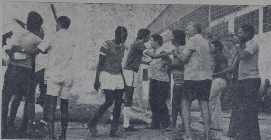
Alguns diretores e torcedores do Filhos de Iguazu, com na mão, perturbaram o jogo no final, inconformados com a derrota do alvi-rubro da Santos Dumont

Com arbitragem de Paulo Viçoso, auxiliado apenas por Durval Meireles, os times alinharam: Clube Municipal — Celso; Lula, Zé Roberto, Minga e Valmir (Florista); Manuel e Baldoque; Robério, Mica (Lelete), China e Pará. Filhos de Iguazu — Pedro; Mário, Jaime, João e Denir; Veríssimo (Manuel) e Jorginho I; Edgar, Jorginho II, Betão e Geraldinho (Queibinho). Na preliminar de juvenil, 1x1.