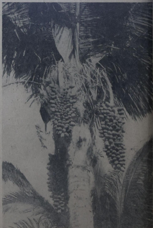
O BABAÇU é uma palmeira linda de bonito revestimento e de grande safra de seus cocos. E, sem dúvida, merece ser melhor tratada e mais protegida em formação das plantações industriais com crédito revisionado sobre controle do ABCAR. Deve ficar mais aproveitada como uma das mais importantes plantas da economia nacional, tanto no mercado interno como no externo em forma de produtos fabricados.

Exposição permanente de pássaros e peixes ornamentais Rua Buenos Aires, 150 Tel.: 221-3875 Rio de Janeiro — Guanabara