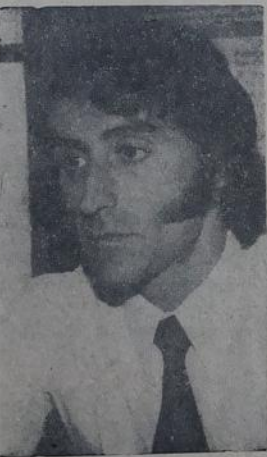
União de Bancos, nova dinâmica

Há dois anos funciona em Queimados o Sub-Posto do Ministério do Trabalho. O maior volume de serviço situa-se no atendimento de centenas de pessoas, que diariamente para ali acorrem em busca de sua carteira profissional. Os carentes de emprego — segundo informações de um funcionário — são encaminhados ao Posto do Departamento Nacional de Mão de Obra, no Centro Iguaçuano. As reclamações são poucas, em média geral, não ultrapassam a casa dos 15 casos mensais.