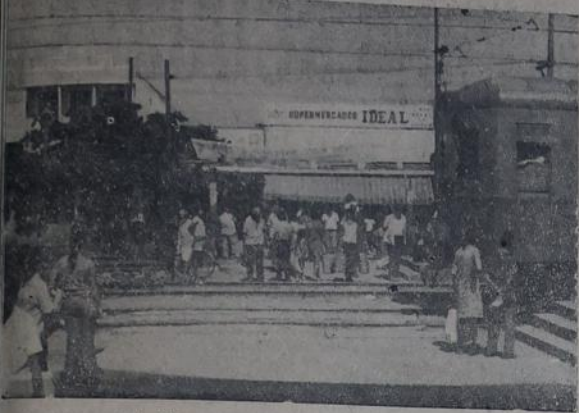
A fadiga passageira pelos trilhos da morte