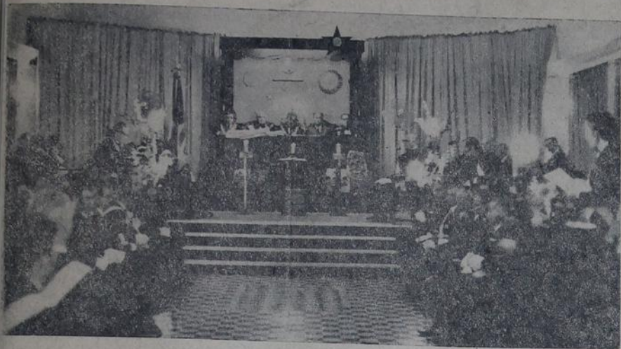
Durante a sessão solene, no templo da Loja Maçônica Mestre Hiram (foto), foi prestada homenagem às mães

Com a presença das mais altas autoridades maçônicas, da Guanabara e do Estado do Rio, os maçons da Loja Mestre Hiram comemoraram o 21.º aniversário de sua loja, com sessão solene e almoço. Diversos oradores se pronunciaram sobre a data e sobre os elevados ideais da maçonaria, mostrando a sua influência nas determinações dos povos. O acontecimento vai noticiado, amplamente, na página sete.